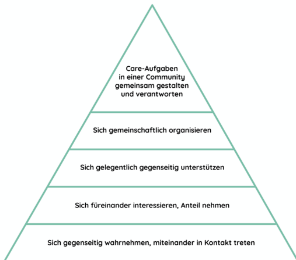
Abbildung 1: Caring-Community-Pyramide – vom Individuum zur Gemeinschaft (R. Sempach, 2019)

Wir unterstützen sowohl CCs, die an der Basis der Pyramide ansetzen und so Grundlagen für das Entstehen von CCs schaffen, sowie auch CCs, in denen Care-Aufgaben in einer Gemeinschaft gemeinsam gestaltet und verantwortet werden.