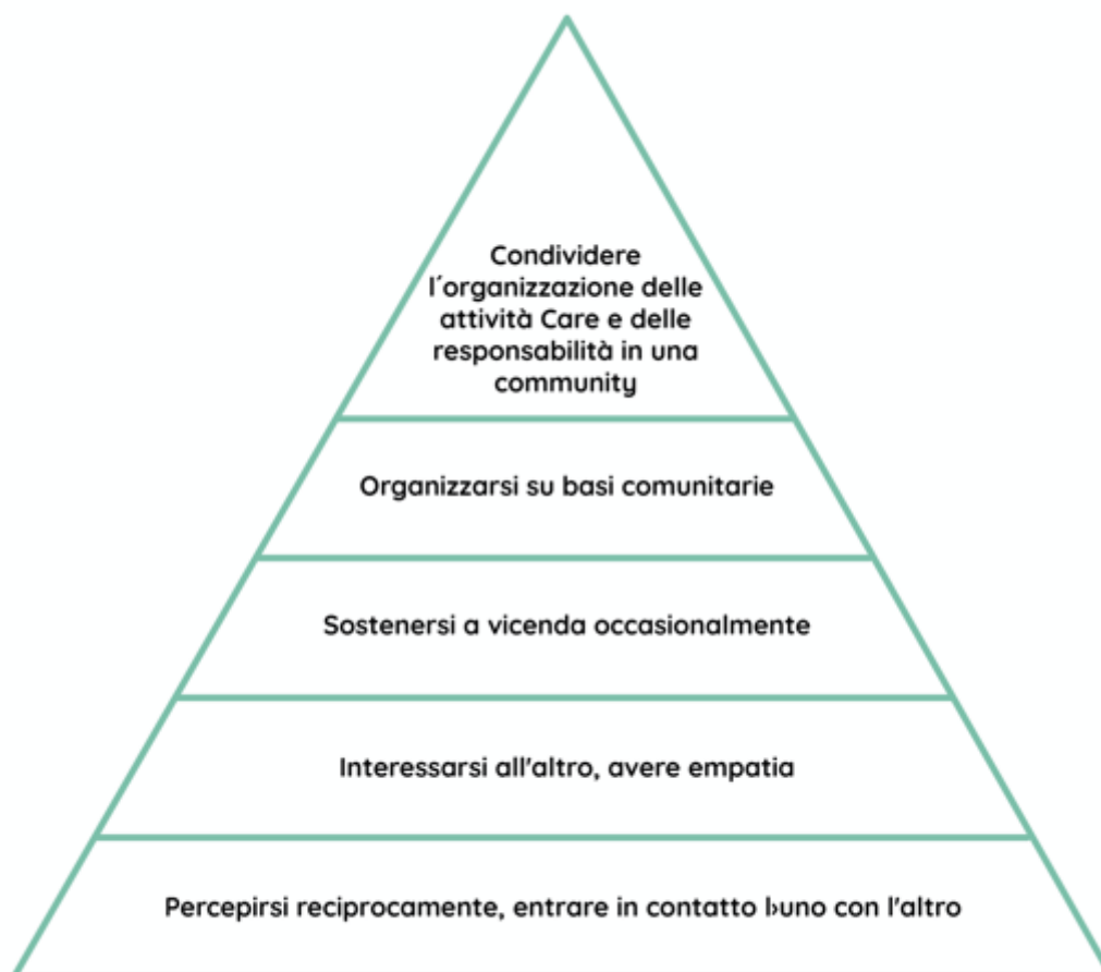
Figura 1: La piramide della caring community – dall'individuo alla collettività (R. Sempach, 2019)

Sosteniamo sia le CC che si situano alla base della piramide – e che in tal modo pongono le basi per la creazione di CC – sia quelle in cui i compiti e la responsabilità del care giving sono strutturati in maniera condivisa all'interno di una comunità.