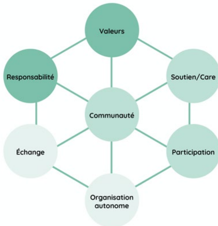
Illustration 2: Modèle 7E d'une communauté de soutien (P. Zängli, 2020)

Les différents éléments (7E) d'une communauté de soutien offrent un éclairage supplémentaire lors de discussions sur les caractéristiques d'une telle communauté.