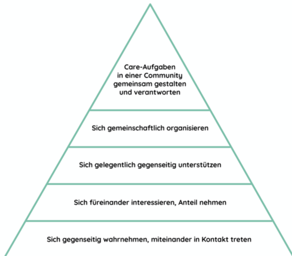
Abbildung 1: Caring-Community-Pyramide – vom Individuum zur Gemeinschaft (R. Sempach, 2019)

Wir unterstützen sowohl CCs, die an der Basis der Pyramide ansetzen und so Grundlagen für das Entstehen von CCs schaffen, sowie auch CCs, in denen Care-Aufgaben in einer Gemeinschaft gemeinsam gestaltet und verantwortet werden.